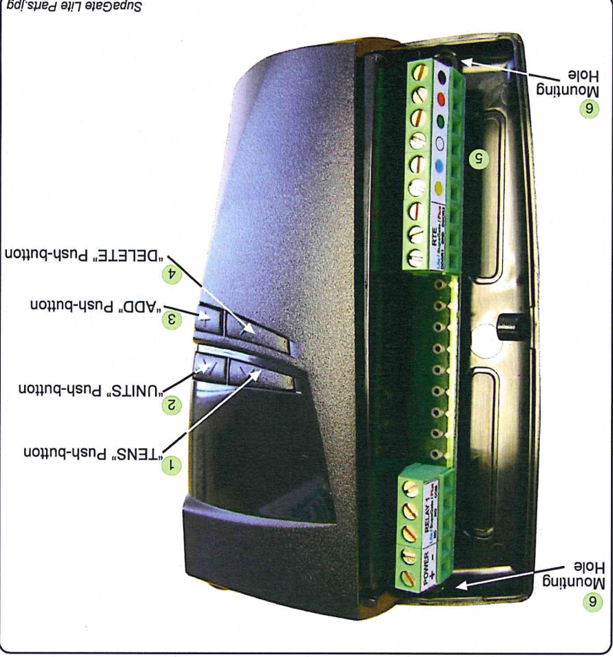
Figure 2: Supagate Lite Layout