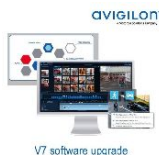
v7 software upgrade

Avigilon ACC7 • Licence upgrade Core vers Entreprise • 1 caméra • Fonction: évolution d'un site ACC7 Core vers les fonctionnalités del'ACC7 Entreprise • Les licences ACC7 étant délivrées par site, il est primordial de nous spécifier le nombre de licence nécessaires par sites différents lors de votre commande. • Points fort: ACC Mobile 3-Avigilon Cloud Service-UMD-UAD-Apparence search-Virtual Matrix-LPR-Face Detection • Notifications: Email-ACC Mobile 3 • Règles: illimitées • Fonctions supplémentaires: Intégration Active Directory-Enquêtes collaboratives-Interface de concentration de l'attention • OS compatible: Windows 10-64-Serveur 2012R2-Serveur 2016 • Statut: actif