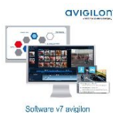
Software v7 avigilon

Avigilon ACC7 • Licence Core • 1 caméra-2 utilisateurs simultanés • Caméras par serveur: jusqu'à 24 caméras par serveur • Les licences ACC7 étant délivrées par site, il est primordial de nous spécifier le nombre de licence nécessaires par sites différents lors de votre commande. • Points fort: ACC Mobile 3-Avigilon Cloud Service-UMD-UAD-Enregistrement sur objet classifié-Marque pages • Notifications: Email-ACC Mobile 3 • Règles: non • Pas compatible avec: caméras H4PRO-Avigilon AI-Avigilon Video Intercom-Avigilon APD-Avigilon ACM • OS compatible: Windows 10-64-Serveur 2012R2-Serveur 2016 • Statut: actif